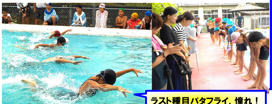
ラスト種目バタフライ、憧れ!

☆校内水泳大会は、1・2年生は直前の土砂降り中止となり楽しみにおいでいただいた皆様には申し訳ありませんでした。3~6年生は実施したものの、途中から雨に...それでも一人一人が3ヶ月間の水泳学習の締めくくりに力泳を見せてくれました。友達への声援もがんばっていましたね。雨の中の応援、ありがとうございました。