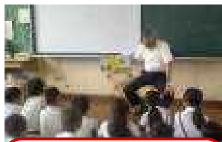
3年・教頭先生 「とけいのおうさま」