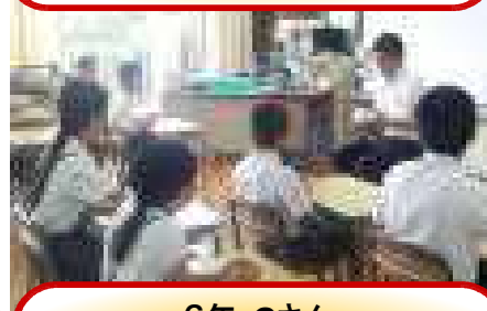
6年・Gさん 「学校嫌い 100万人目のお客様」