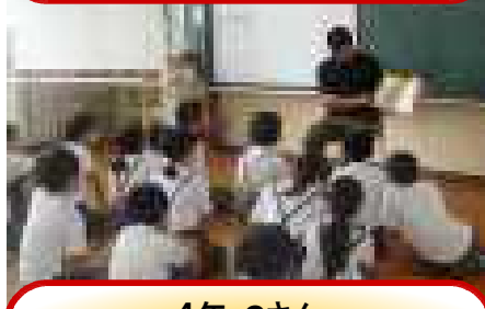
4年・Cさん 「まんてんぺんとう」