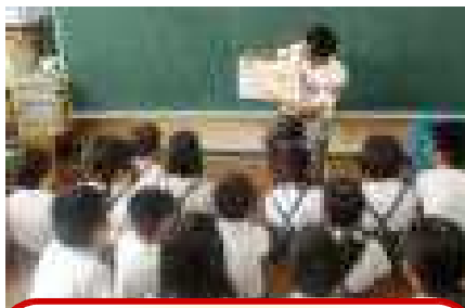
2年・Bさん 「ころべばいいのに」