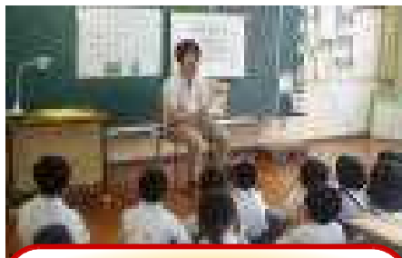
1年・Aさん 「いのちをいただく」

☆本年度2回目の読み聞かせは、オールお父さん（+教頭先生）でしていただきました。お仕事の合間を縫って駆けつけてくださり、感謝、感謝です。 ☆選書もそれぞれ个性的で、子どもたちもワクワクしながらお話の世界に入り込んでいました。笑顔でやさしい語り口、お母さん方に負けないくらいステキでした。