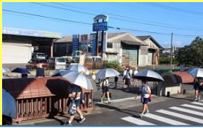
暑さに負けず登校