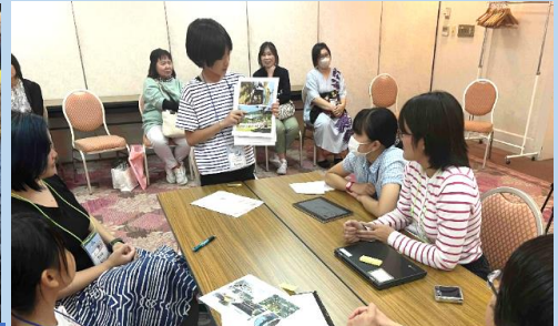
県内から集まった友達の発表を聞き、各地のふるさとのよさを発見しました