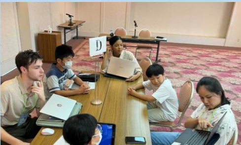
ALTのふるさと自慢を聞いて、様々な国の様子を知ることができました

熊本県では、グローバル人材の育成に向けて、県内の小中学生等を対象にALT（外国語指導助手）と交流する活動を実施しています。「Do you know my hometown?～ふるさと自慢in English!～」のテーマのもと、子どもたちは、ALTに自分が住む地域のよさを英語で伝える活動などを通して、英語によるコミュニケーションの楽しさを実感し、これからの英語学習への意欲を高めていました。