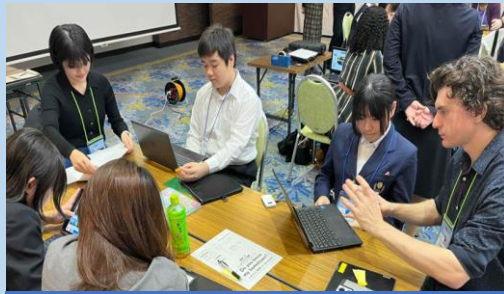
ALTとコミュニケーションを図りながら、ふるさと自慢の発表内容を練り上げました