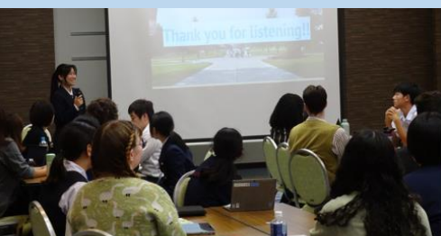
州立モンタナ大学派遣高校生の発表を聞き、留学への興味が高まりました