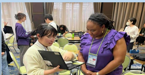
最後に、ALTと1対1になり、自分のふるさとを紹介しました。多くのALTとのかかわりを通して、徐々に自信をつけ、英語によるコミュニケーションを楽しみました