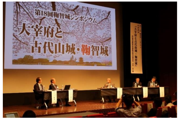
（パネルディスカッションの様子）

鞠智城シンポジウムの発表要旨は「全国遺跡報告総覧」にアップロードされています。ぜひご覧ください。