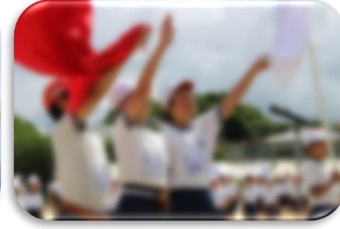
激走する のびっ子 徒走・リレー