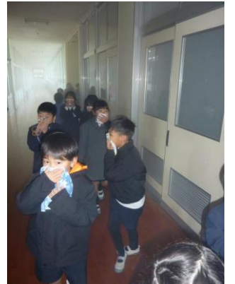
〔煙中での避難の様子〕