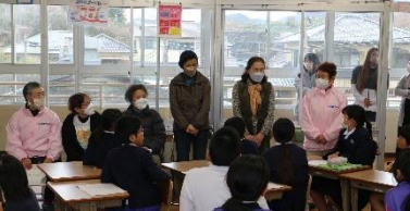
更生女性会の皆様方