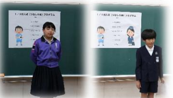
将来の夢を発表する4年生

四年生と二分の一人式「つなしの会」を開き十歳のお祝いをしました。全員が将来の夢について語り、十歳の誓いを述べました。更生保護女性会の方々が来校くださり、手作りのお祝いの色紙を子供たち一人一人にいただきました。つなしの会を通して、成長の意味とともに地域の皆さまに見守られている喜びを感じたのびっ子たちでした。