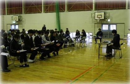
多くの会員の方々にご参加いただき議事が進みました ご活躍いただいた会員の方への感謝状の授与