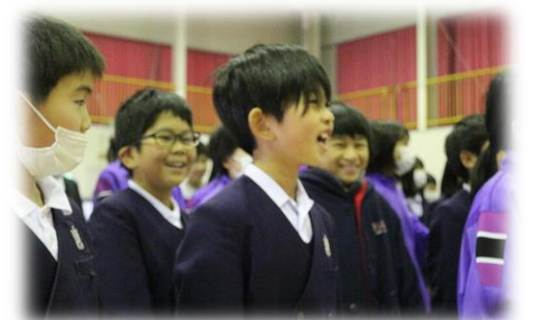
「心の中を表現する大切さを実感」

水俣に学ぶ肥後っ子教室 5年生が水俣の地に出向き、学びを深めました。一年間進めてきた環境学習を起点とした水俣病に係る人権問題解決に向けた学習をまとめました。