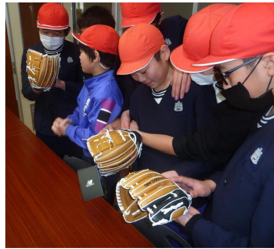
「よし、自分も夢実現！」