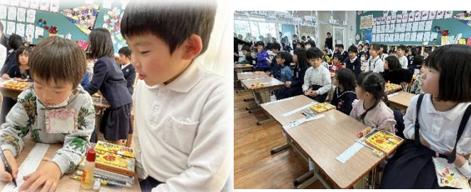
新入児童と関わった一年生がとて大きく、五年生がとて遅し感じられました

四月に入学する新しい一年生の子供たちが小学校生活を送りました。来年は二十五人の子供たちがのびっ子の仲間入りする予定です。元氣な返事と自己紹介までできました。学ばれた子供たちです。学校探検では五年生が手を繋いで校内探検に出かけました。お世話してくれました。一年生の姿がとても遅く、大きき感じがしました。ちびっ子全員で入学を待ち望んでいます。