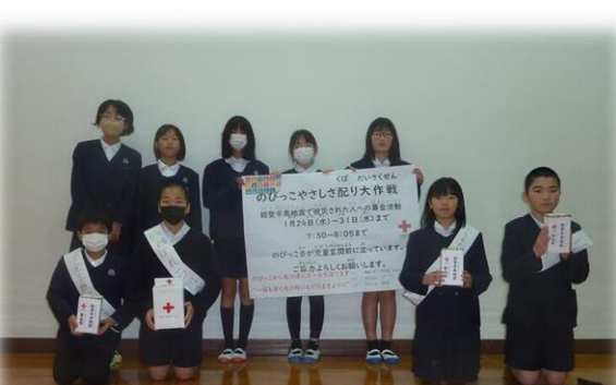
のびっ子の尊い思いが届きますように

能登半島地震において被害にあわれた方々へ向けてのびっ子会が動き出しました。児童集会で、震災へののびっ子の行動について話し合い活動を行いました。「優しさを配る」ことを視点に全員で、自分たちにできる「やさしさ」について考えました。心を使いながらしっかりと考えを深めた時間でした。その後のはのびっ子会が中心となり、募金活動に取り組むことになり、「のびっこやさしさ配り大作戦」と題した支援活動を進めています。「自分たちにできること」への行動がのびっ子から立ち上がった活動です。のびっ子の思いが届き、平和な日常への復興への一助となることを願います。 ※募金（募金額四四八五一円）は日本赤十字社を通じて、被災地の復興支援に活用いただきますことを申し添えます。