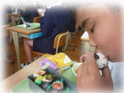
笑顔の奥には感謝の心が感じられました。

縦割り班活動 三学期の掃除の時間は、縦割り班掃除を行っています。1年生から6年生までの全員が9班に分かれて、校内を時間いっぱい掃除しました。活動では6年生が中心となって、掃除の段取りを説明したり、1年生には適切な掃除の方法を教えたりするなど、学びの多い時間となりました。最後は反省会も自分たちで進め、互いを認め合い、助け合うという大切なつながりを体験したのびっ子たちでした。「のびっ子ドラえもん・アンパンマン化計画」がスタートしたようです。