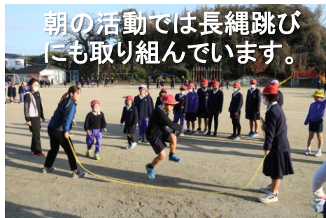
朝の活動では長縄跳びにも取り組んでいます。