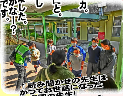
↑読み聞かせの先生は かつてお世話になった 保育園の先生！ 昔話に花が咲きました。

読み聞かせが復活しました！ ご協力いただいたのは、 読み聞かせボランティアの皆様 約一年半ぶりの活動に 読み手も聞き手も ワクワク、ドキドキの時間を 過ごしました。 例年、対面式で開催のこの活動 ご存じのとおり、コロナの影響で なかなか実現できずにいました。 しかし、普段と勝手が違うのは 大人も子供もいっしょに…… 目の前に立ちほだだったのは ICT活用という大きな壁でした。 顔合わせにリハーサルで、 2回の手続きを踏んで、 本番をむかえました。 終わってみると なんだか心と体がポッカポカ。 ボランティアの皆様からは 「リモート形式とはいえ、 こういうのも有りですね……」と。 先日はどんちゃん号が来校し 子供たちは、本を手にしていました。 思い思いに読み聞かせはいつかな？ 二回目の読み聞かせはいつかな？ そんな声が聞こえてきそうです。