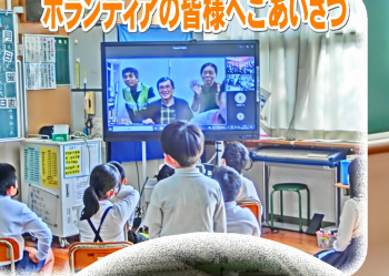
ボランティアの皆様へごあいさつ