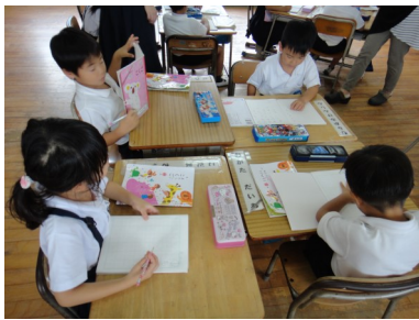
【本日の1年生国語～意欲的でした】