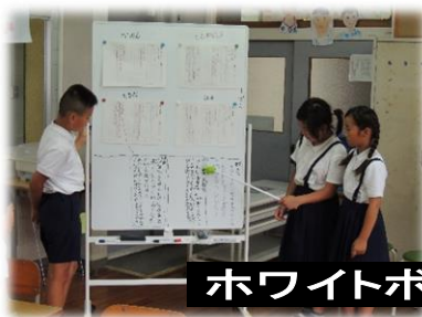
ホワイトボードを活用