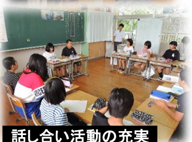
話し合い活動の充実