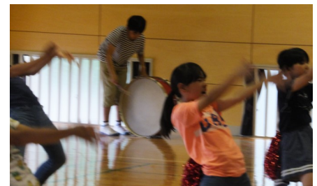
【応援団の練習風景】