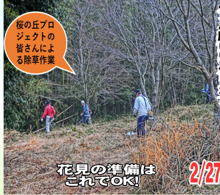
花見の準備はこれでOK!