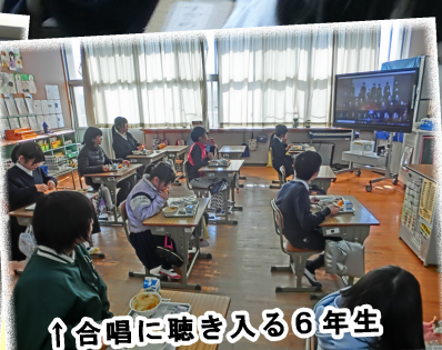
↑西合志中学校の合唱