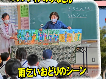
雨乞いおどりのシーン