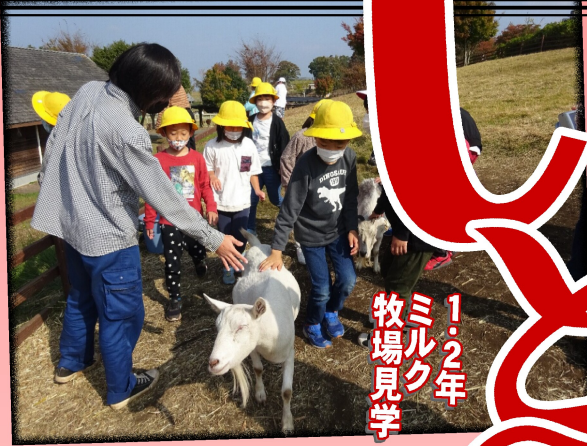
1・2年 ミルク 牧場見学