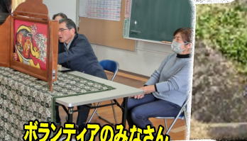
ボランティアのみなさん