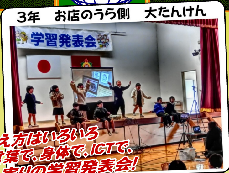
3年 お店のうら側 大たんけん