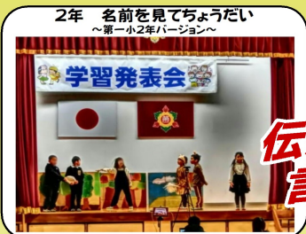
2年 名前を見てちょうだい ～第一小2年バージョン～