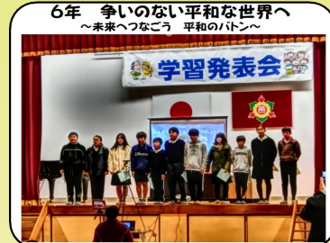
6年 争いのない平和な世界へ ～未来へつなごう 平和のバトン～