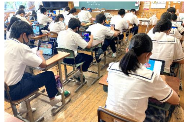
英語の企画書作りに取り組む様子（あさぎり町立あさぎり中学校・外国語科）