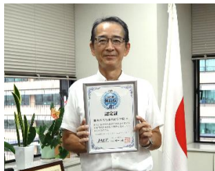
8月23日に本年度九州初の高等学校優良校に熊本西高等学校が認定されました。

子供たちの学びが大きく変わるということは、教師の指導方法も大きく変わることになります。従来型の一斉授業から、個人の実態に応じたきめ細やかな学びや、積極的に友達と一緒に課題を解決していく学びを行っていくことで子供たちの将来につながる確かな力を育てていきます。