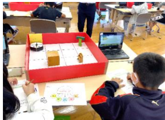
1人1台端末を活用したプログラミング学習の様子（美里町立砥用小学校）