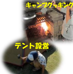
キャンプファイティング テント設営