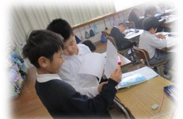
2年生、2人で答え合わせ