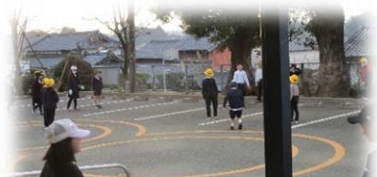
1・2年生、外で元気に