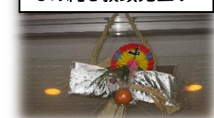
しめ縄も教頭先生が

の学校愛及びアイデアにやられました。このお陰で、本年のきれいな初日の出を拝見することができました。今年も西合志第一小学校に関わるすべての人にとってよい年になりますように！