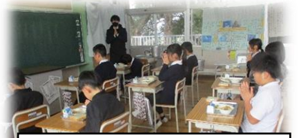
5・6年生、「いただきます」