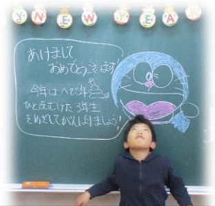
ドラえもんと一緒に

の学校愛及びアイデアにやられました。このお陰で、本年のきれいな初日の出を拝見することができました。今年も西合志第一小学校に関わるすべての人にとってよい年になりますように！