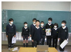
環境 ISO 美化委員会