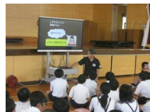
聞いて学んでます