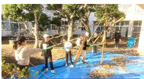
3年生の大豆の脱穀 「すがたをかえる大豆」 国語と総合の勉強です