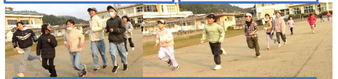
朝のランランタイム初日の様子です。今はもっと寒いですが、がんばって走っています。

みなさんががんばっている姿から、ありがとうと言いたい場面がたくさんありました。子どもたちのおかげ、先生たちのおかげ、家族の皆様のおかげ、地域の方々のおかげです。本当にありがとうございました。