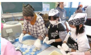
5年生、育てたもち米でもちをつくり、たくさんの人に配ってくれました。