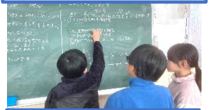
4年 解けるまで頭を絞って考えます