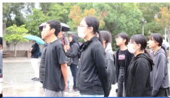
6年 修学旅行の平和集会(平和祈念像の前で宣言しました)