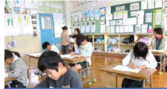
2年 チャレンジタイム全問 終わるまで集中しています