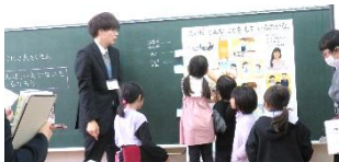
1年 家族のくらし方を考えています