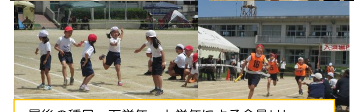
最後の種目、下学年、上学年による全員リレー どちらも接戦です