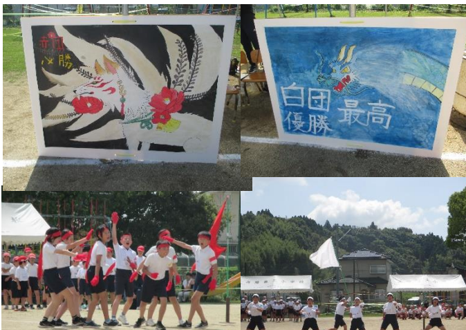
赤団。白団、ともに気合いの入った応援合戦でした

「地域の温かさと頼もしさを実感した作業だった。地域の人たちは誰もが学校に愛着を持っている。田舎ならではの地域性が学校運営に役立つように見守っていきたいと思う」と結ばれています。思いに応えられるよう取り組んでまいります。