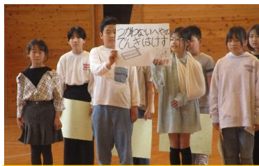
5年生 学校の決まりを 〇×クイズにしました。