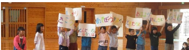
2・3年生 学校生活のおやくそくを教えてくださいました。