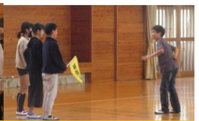
6年生 劇をして学校の様子を 教えてくださいました。