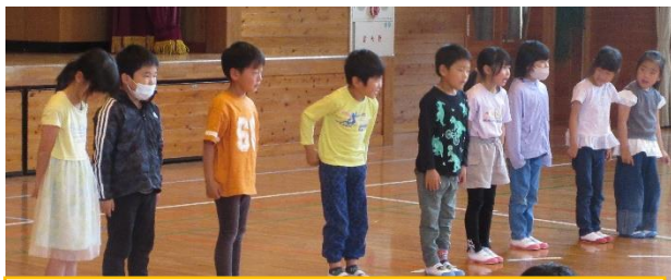
1年生 自分の名前と好きな物を発表しました。

4月19日に児童会主催で行われました。入学式から1週間、ずいぶん慣れてきた1年生です。1年生の自己紹介の後、各学年からの出し物やレクレーションを通して、1年生は大変喜んでいました。その後には、たて割り班でふれあい広場に遠足、弁当を食べ楽しく遊ぶこともできました。上級生は、1年生のお世話をよくしてくれています。とても感心です。