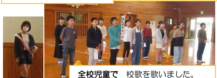
全校児童で 校歌を歌いました。 6年生がリードしてくれました。