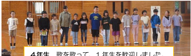
4年生 歌を歌って、1年生を歓迎しました。

PTA 総会も無事に終わることができました。今年度のPTA 活動が活発にできることをうれしく思います。さっそく、5月21日の運動会では、PTA 競技として「綱引き」が計画されています。よろしく願います。