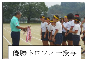
優勝トロフィー授与