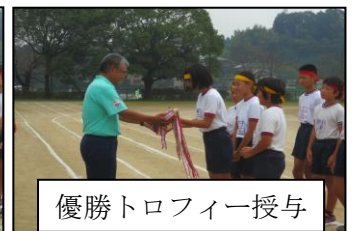
優勝トロフィー授与

【ICT機器を使って】タブレットや書画カメラ、電子黒板などのICT機器を活用した授業により、子どもたちが目を輝かせ、よりわかる授業を目指しています。画像で紹介します。