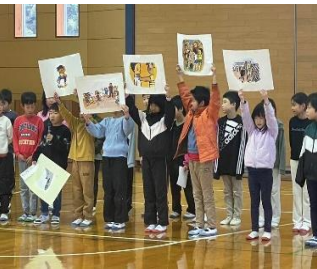
11/27 校内人権集会 いじめや差別をなくす取組をずっと続けることを確認できました。