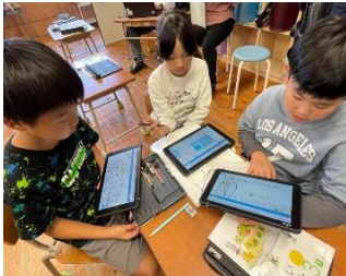
11/133年教室で学習リーダーを中心とした算数の研究授業が行われました。