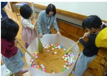
11/11 1年生は給食センターへ行き、見学と給食試食会を行いました。