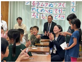
11/1 南関町人権・同和教育公開授業研究会、1年生の心温まる授業でした。