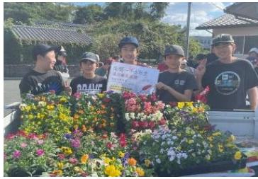
11/6 6年生が慈幸苑のみなさんと交流会を行いました。花の苗も植えました。