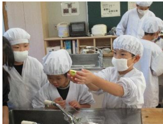
11/8 むくのき学級とひばり学級のみんながサラダパーティーをしました。