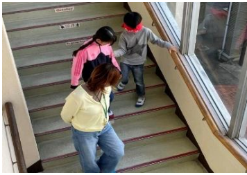
11/5 4年生は福祉体験学習を行いました。貴重な体験をすることができました。