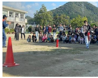
11/6地震・火災避難訓練を行いました。消火訓練にも挑戦しました。