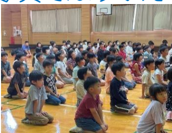
10/6 前期終業式では、みんなで写真を見ながら、前期の振り返りをしました。