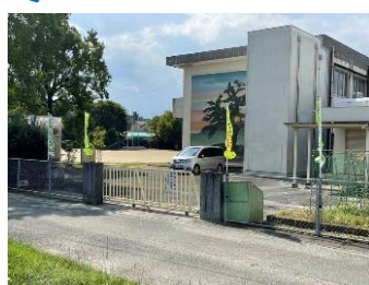
10/10 東門の左右に事務の先生が防犯用ののぼり旗を取り付けてくださいました。