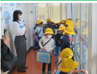
10/23 低学年の生活科見学旅行では、らくのうマザーズ熊本工場を見学しました。