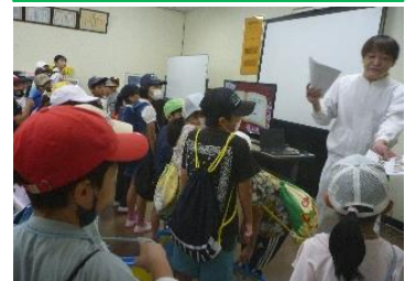
10/10 3年生は、丸美屋の工場見学に出かけ、大豆のことを詳しく学びました。