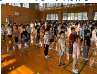
10/10 後期始業式では、「新しいことにチャレンジしよう!」と話しました。