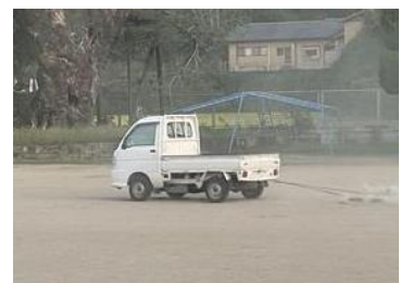
10/4 体育主任の先生がグラウンド整備をしてくださいました。軽トラ大活躍です。