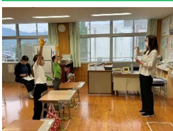
10/27 むくのき学級研究授業では、相手を傷つけない言葉のつかい方を学びました。