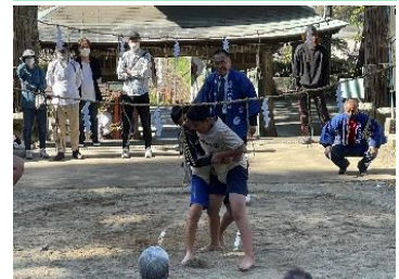
10/22 大津山阿蘇神社境内で大津山子ども相撲大会が4年ぶりに開催されました。