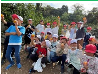
10/26 3年生社会科見学旅行では、水本オレンジガーデンのみかんが最高でした。