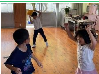
10/19 昼休みのひとコマ。1年生が帽子を使って花笠音頭を踊ってくださいました。