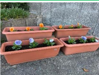
10/18 校門前のプランターに用務員の先生がパンジーを植えてくださいました。