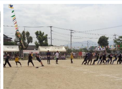
支館競技（メディシングボール） P T A 競技（綱引き）