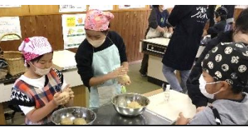
③ 味噌づくりにチャレンジ!