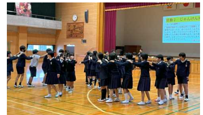
みんなでじゃんけん列車

1月18日（木）、6年生の大矢野中学校体験入学が行われました。体育館で整列した6年生は、はじめは少し緊張した表情でしたが、これまでも集団宿泊や水泳記録会や陸上記録会などを通して顔見知りの児童も多かったので、中学校で行われている「大中タイム」の体験では、リラックスして参加していました。その後、生徒会より説明がありました。本校卒業の2名の先輩もみんなの前に立って説明する姿がとても頼もしく感じました。