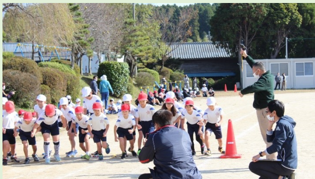
中学年(1500m)のスタート