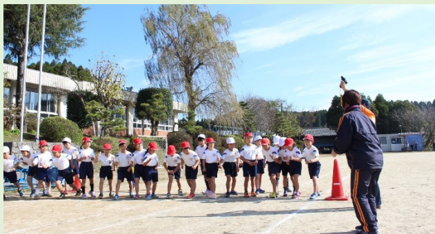
低学年(1000m)のスタート

11月27日(金)の3,4校時に「校内持久走大会」を行いました。大会に向け、練習を重ねました。それぞれが自分の記録との競争です。1年生にとっては初めての持久走大会。そして、全員にとって中松小最後の持久走大会となりました。