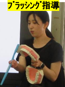
ブラッシング指導