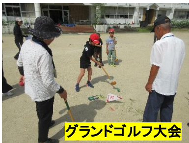
グランドゴルフ大会

20日(金)に、1・2・3年生は、たくさんの地域の方々と交流会を行いました。まずは、運動場でグランドゴルフをし、地域の方とペアを組んで競技を楽しみました。後半は、室内で七夕の短冊書きや飾りをしました。とても楽しい会になりました。ご協力くださいました地域の皆様方、暑い中ありがとうございました。