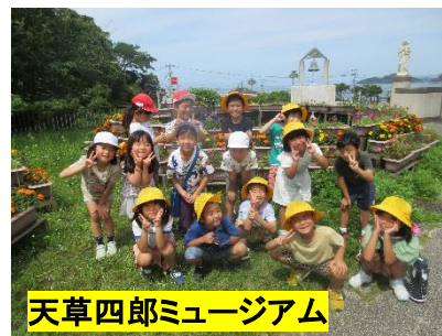
天草四郎ミュージアム

18日(水)に1・2年生は、町探検に出かけ、「自分たちの住む地域にはどんなものや場所があるのか」調べにきました。町のいいところ新発見・再発見の活動ですね。