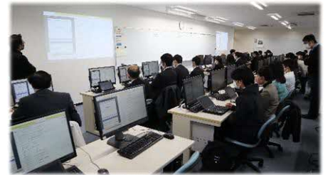
高校・情報Iプログラミング担当者研修会の様子

熊本高等専門学校との連携の一環として、「第1回高校・情報Iプログラミング担当者研修会」を実施しました(R5.2.15)。高等学校の「情報I」を担当する教員に対し、熊本高専の教員が講師となりプログラミング演習を行いました。