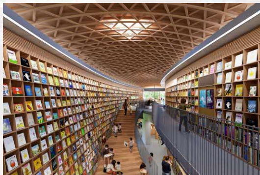
熊本県ホームページ