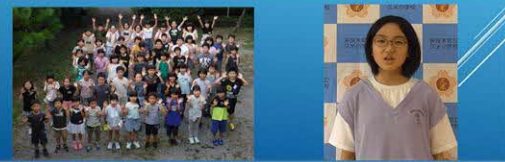
多良木町立久米小学校

テーマ 「みんななかよく、 がっこう げんき ちいき 学校の元気を地域にとどけよう」