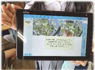
小学校低学年から日常的な端末活用

1人1台の学習端末(タブレット等)を活用し、「学力向上」、「不登校対策」、「情報活用能力の育成」を進めるなど、地域の実態に即した組織的な取組みが評価されました。