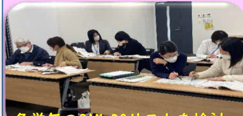
各学年のCAN-DOリストを検討

小中英語担当教員向け研修を年2回実施し、大津町版「CAN-DOリスト」を作成しました