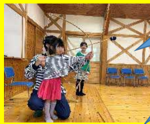
大人から子どもまで、みんな で楽しみました