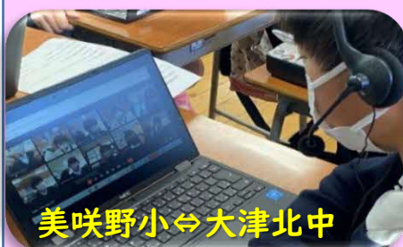
美咲野小⇄大津北中

校種の違う児童生徒が英語で互いにやり取りし、コミュニケーションの楽しさを実感しました