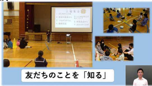
友だちのことを「知る」