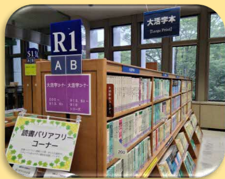
県立図書館の「拡大図書」コーナー