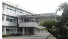
県立八代中学校・八代高等学校

～熊本県では、令和6年度から八代中学校・八代高等学校に国際バカロレアの導入を目指しています～