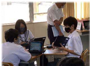
考えを表現するツールとしての端末活用