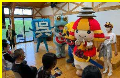
ころう君と仲間たちによる 楽しいショー