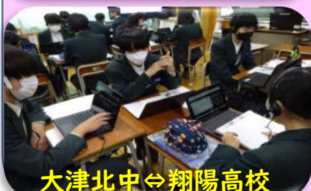
大津北中⇄翔陽高校