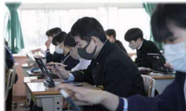
解説動画付き教材で個に応じた学びの充実