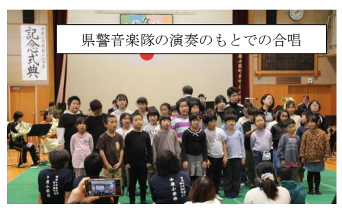
県警音楽隊の演奏のもとでの合唱