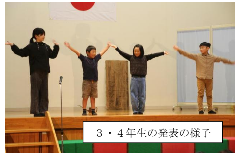
3・4年生の発表の様子