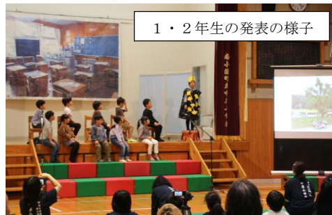
1・2年生の発表の様子