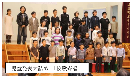
児童発表大詰め:「校歌斉唱」