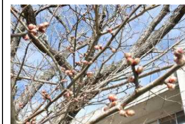
校庭の梅のつぼみが今にも開きそうです。