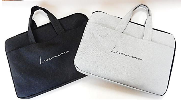
タブレットケース