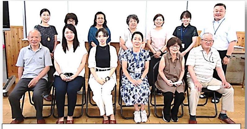
第1回の協議会にご出席くださった協議会委員の皆さんと

菊陽町では、町内全小中学校に、学校運営協議会を設置し、「地域とともにある学校づくり」を目指しています。本校では第1回の協議会を7月9日（金）に実施し、協議会の委員の皆さまへの委嘱状交付、校長が作成する学校運営の基本方針の説明と承認、また、授業の様子も参観していただき、その後意見交換を行いました。これから学校と保護者と地域の皆様とで、ともに知恵を出し合い、一緒に協働しながら子どもたちの豊かな成長を支え、「地域とともにある学校づくり」を進めていけるよう取り組んでいきます。