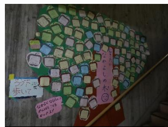
武北小なかよしの木

6月は、人権月間です。本校では、6月、11月、2月を人権月間と位置づけ、取組の強化を行っています。各クラスでは、人権教育の授業を行ったり、全校集会であるスマイル集会では人権委員会の発表があったりとみんなで人権についてしっかり考える時間が設けられています。また、校内には「なかよしの木」「ありがとうの木」なども掲示し、友だちへのメッセージを書いています。