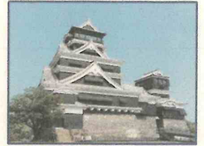
くまもと じょう 熊本城