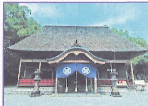
あおい あそじんしゃ 青井阿蘇神社