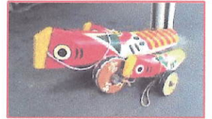
きょうどがんく うま 郷土玩具のきじ馬