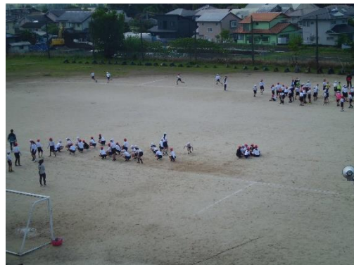
切磋琢磨 (2025/5/2 撮影)

昨日、ある会合で挨拶をすることになり、ちょうど1年前の同じ日に行われた会の原稿を読み返しました。そこには冒頭に、「5月とは思えない猛暑の中で…」との言葉がありました。今年は随分過ごしやすい5月のスタートです。校内をまわっていると、学年がすっぽりと不在という時があります。運動会に向け、学年で合同練習を行っています。運動会は日ごろの体育学習の成果を披露する場です。同時に学級・学年・学校が同じ目標に向けて、なかまをだいに取り組む行事です。今年は5月24日。みんなで準備を進めます。