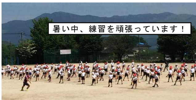
暑い中、練習を頑張っています！

8時から、刈った草の片付け等に、たくさんの保護者の皆様や子どもたちに参加してもらいましたので、予定より早く終わることができました。きれいになった運動場で、運動会の練習を頑張りたいと思います。29日(日)の運動会をお楽しみに！