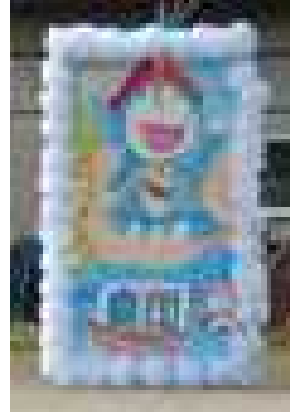
[赤団はクレヨンしんちゃん] [白団はドラえもん]