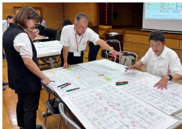
図4 単元配列表作成の様子

基に、年度当初の校内研修の時間を利用して、単元配列表を作成した。図4は、その時の様子である。育成すべき資質・能力にむけて、各教科や単元がどのように関連していくかを探るべく、児童生徒の探求的な学びや社会との関わりを育む中核となる「生活科・総合的な学習の時間」を中心として、矢印で結んだり、付箋を貼ったりして、全学年の年間指導計画を詳細に分析した。指導内容の俯瞰や関連性の明