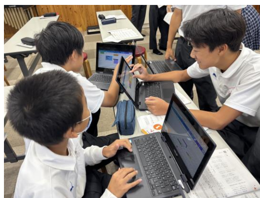
図7 タブレットを活用して意見共有する様子

▼音楽の鑑賞を通して知覚・感受したことを、音楽的な要素に基づいて表現することに、個人差が見られた。