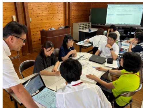
図2 教職員の対話の様子