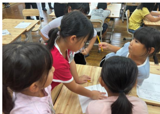
図5 対話を通して課題解決をしている様子

▼グループや役割などの決め方において、児童が好きに決めるのではなく、教師がある程度先導した方が、学び合いがより深まるように感じた。