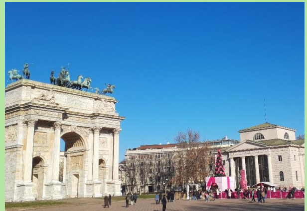
広場にできたスケート場