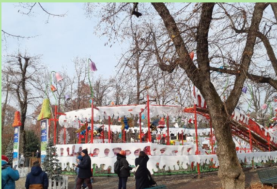
ミニミニジェットコースター