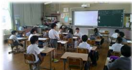
← 2 年

校内研修では、上で説明した「 学習規律（学習する上でのルール）を学校全体で整えること 」と「 ICTの効果的な活用 」について取り組んでいます。先生方のICTの活用が向上するようお互いの授業を参観し、自分の授業に生かす「 見せあい授業 」に取り組んでいます。先生方もステップアップしていき、子ども達の学びを充実させられるようにしていきます。