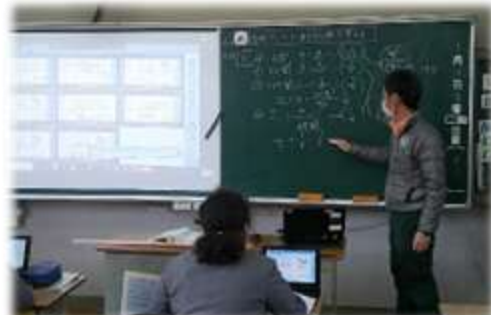
← 6 年