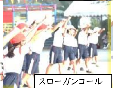
スローガンコール