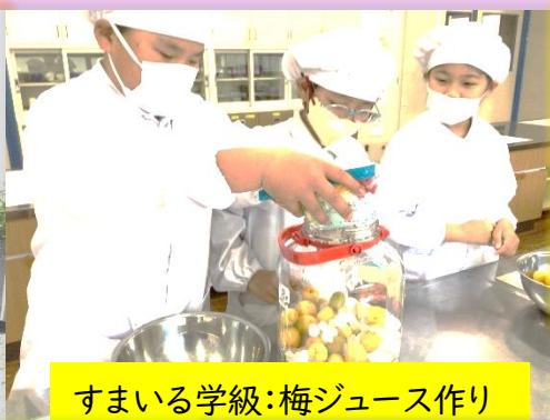
すまいる学級:梅ジュース作り