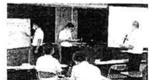
玉名管内での研修の一場面

○今回学んだことを基に、町内の小中学校で方向性を揃えて、小中学校のつながりがある教育活動を進めていきたいと思っています。