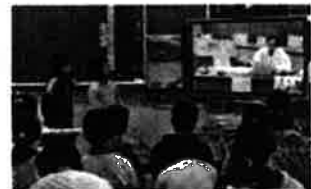
小6「理科」 JAXAの研究者とテレビ会議を実施し、星や天体への興味を高めた

御家庭でも、「学ぶことのすばらしさ、楽しさ」を子供たちに伝えていただきますようお願いいたします。