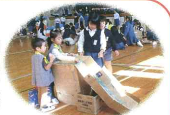
★「宇土市立花園小学校おもちゃ祭」 花園小学校2年生、花園幼稚園、 はなどの保育園、たんぼぼ保育園、 ありあけ保育園年長児

宇土幼稚園 花園幼稚園 かもめ保育園 松合ふたば保育園 白梅幼稚園 不知火保育園 中央青葉保育園 堅志田保育園 青空保育園 当尾保育園 花園小学校 宇土小学校 走湯小学校 緑川小学校 網津小学校 宇土東小学校 三角小学校 不知火小学校 松合小学校 豊川小学校 中央小学校 鶴城中学校 中央中学校 不知火中学校