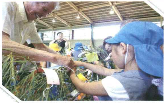
★「宇土市立花園小学校七夕交流会」 花園小学校1年生、老人会、婦人会、花園幼稚園 はなどの保育園、たんぼぼ保育園、ありあけ保育園年長児