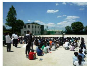
避難訓練での講話