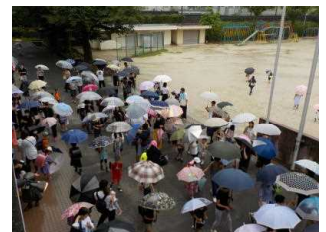
引き渡し訓練の様子