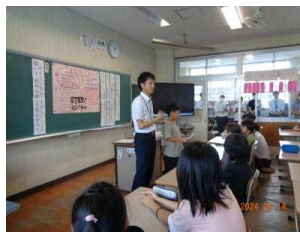
5年生の授業の様子

人権旬間では、全ての学級での人権学習、学年集会などを行い、自分たちの生活を振り返っていました。