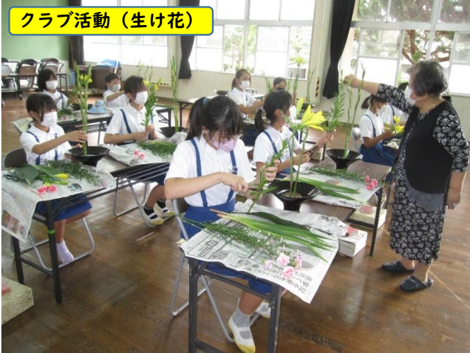
クラブ活動（生け花）