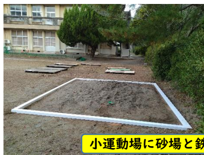
小運動場に砂場と鉄棒を設置しました