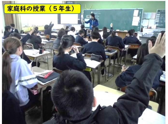
家庭科の授業（5年生）