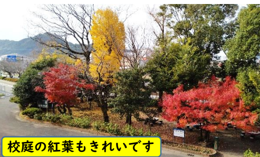
校庭の紅葉もきれいです