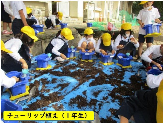
チューリップ植え（1年生）